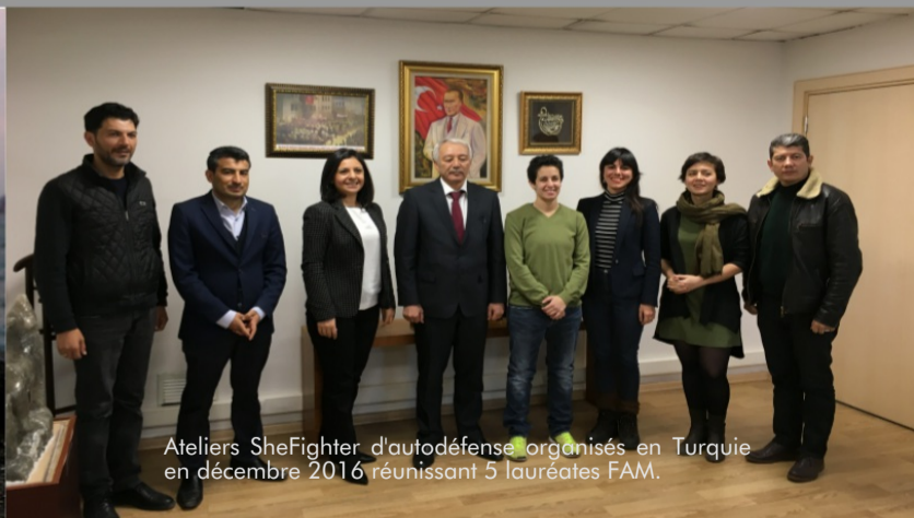
Ateliers SheFighter d'autodéfense organisés en Turquie en décembre 2016 réunissant 5 lauréates FAM.

Projet d'Observatoire Maghrébin des questions de genre par 3 lauréates FAM.